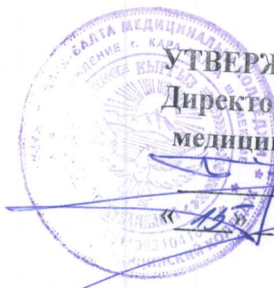
График прохождения повышения квалификации преподавателей КБМК на 2023-2024 учебный год